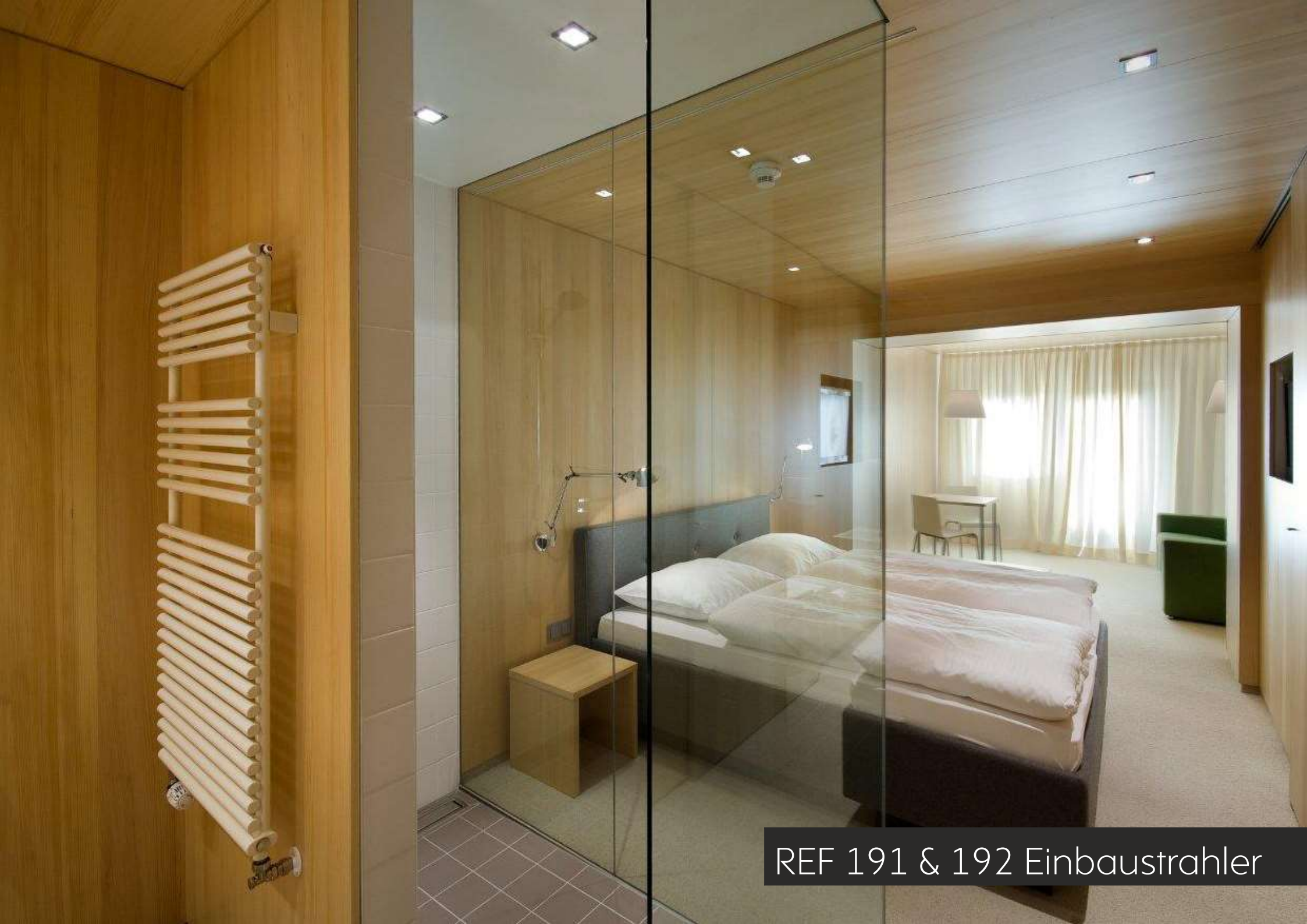
REF 191 & 192 Einbaustrahler