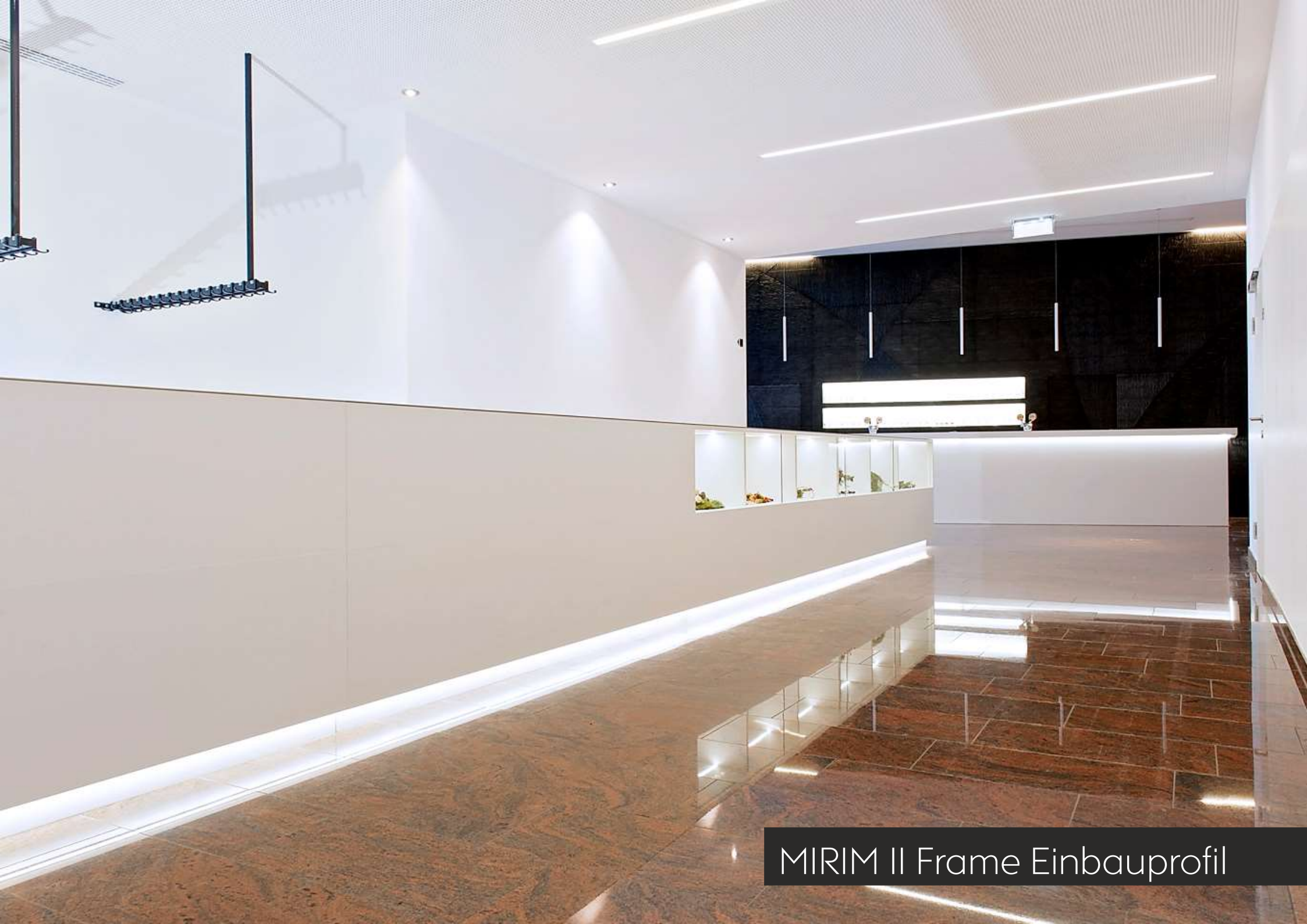
MIRIM II Frame Einbauprofil